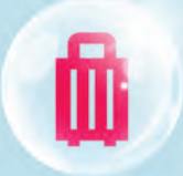
បណ្ណសន្យារ៉ាប់រងលើអ្នកដំណើរ