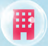
បណ្ណសន្យារ៉ាប់រងការការពារគេហដ្ឋាន