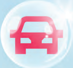
បណ្ណសន្យារ៉ាប់រងយានយន្ត

យើងផ្តល់ជូននូវដំណោះស្រាយធានារ៉ាប់រងទូទៅដ៏សម្បូរបែប ដែលត្រូវបានចនាឡើងដើម្បីការពាររាល់ដំណើរនៃជីវិតប្រចាំថ្ងៃ ដើម្បីផ្តល់ជូនលោកអ្នកនូវភាពជឿជាក់គ្រប់ទីកន្លែង។ យើងផ្តល់ជូននូវដំណោះស្រាយធានារ៉ាប់រងទូទៅគ្រប់ជ្រុងជ្រោយ ដែលត្រូវបានចនាឡើងដើម្បីការពាររាល់ដំណើរនៃជីវិតប្រចាំថ្ងៃ ព្រមទាំងពង្រីកសីលភាពទៅជាប្រព័ន្ធអេកូឡូស៊ីនៃកិច្ចការពារសម្រាប់ បុគ្គល សហគ្រាសធុនតូចនិងមធ្យម (SME) សាជីវកម្ម ហានិភ័យឯកទេស កសិកម្ម អត្ថប្រយោជន៍បុគ្គលិក និងធានារ៉ាប់រងអាយុជីវិត ដើម្បីផ្តល់ជូនលោកអ្នកនូវភាពជឿជាក់ និងភាពកក់ក្តៅក្នុងចិត្តនៅគ្រប់ទីកន្លែង។