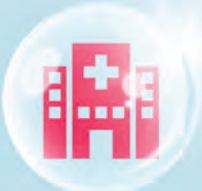
បណ្ណសន្យារ៉ាប់រងវេជ្ជសាស្ត្រអន្តរជាតិ