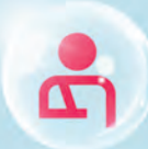
បណ្ណសន្យារ៉ាប់រងគ្រោះថ្នាក់បុគ្គល