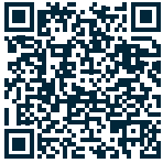
ពាក្យស្នើសុំទាមទារសំណង

ក្រុមហ៊ុនធានារ៉ាប់រងហ្វឺត (កម្ពុជា) ភីអិលស៊ី សូមរក្សាសិទ្ធិដើម្បីកែប្រែវិធានទាមទារសំណងនេះ ដោយមិនជូនដំណឹងជាមុន។ លោកអ្នកអាចទទួលបានវិធានទាមទារសំណងដែលធ្វើបច្ចុប្បន្នភាពរួច តាមរយៈគេហទំព័ររបស់យើងខ្ញុំ www.forteinsurance.com